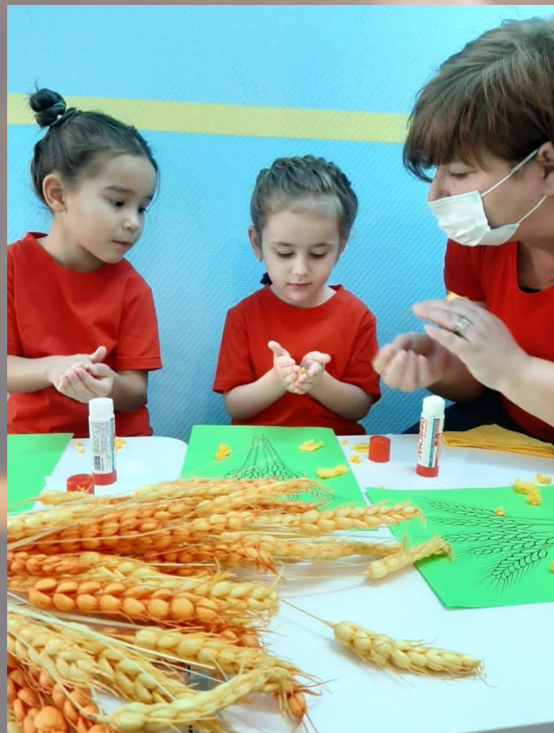
Детский сад г. Ростов-на-Дону