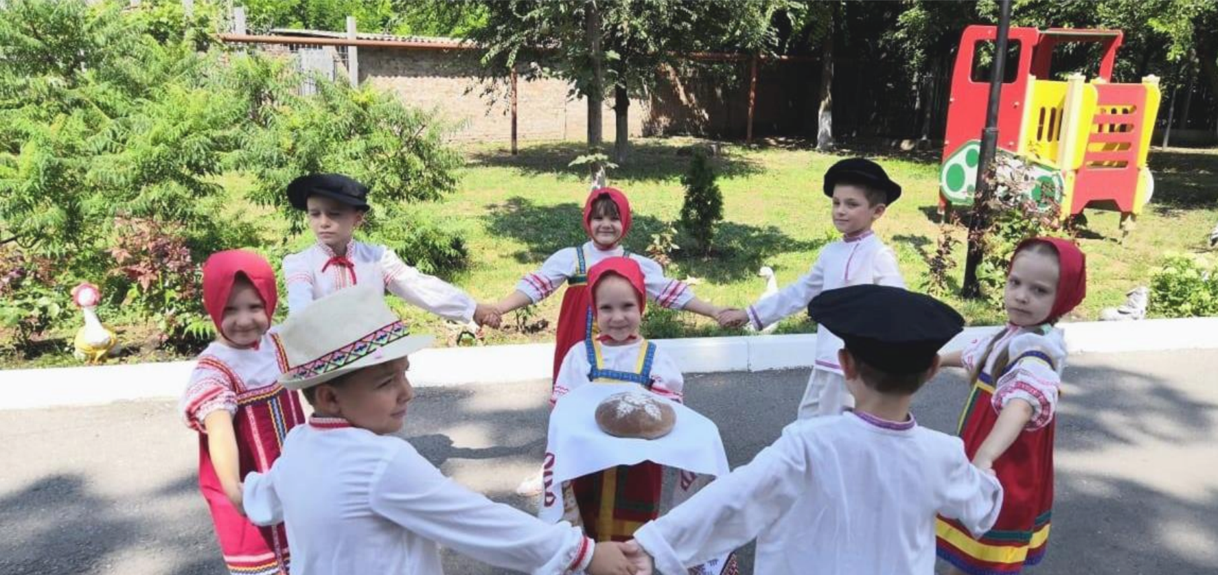
МБДОУ №211 г. Ростова-на-Дону