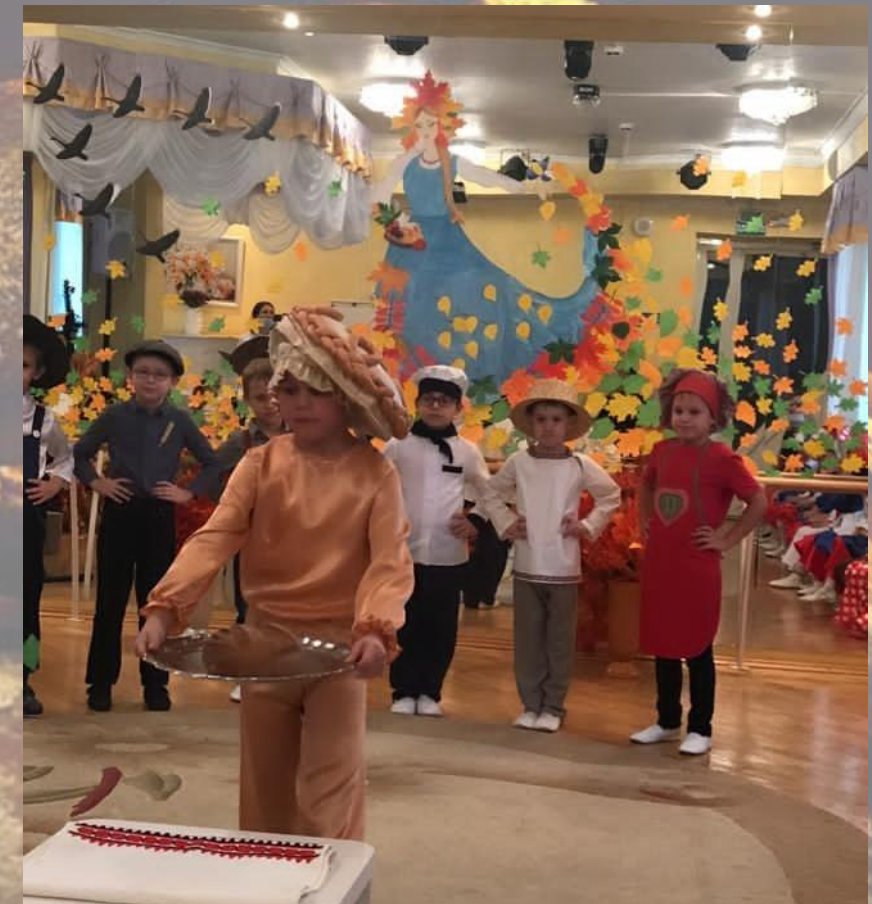
МБДОУ №211 г. Ростова-на-Дону