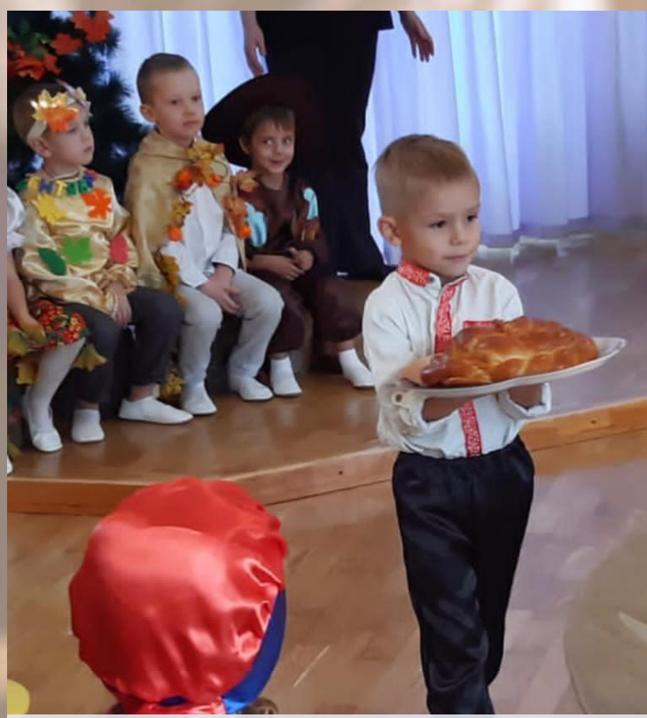
МБДОУ д/с №33 «Буратино» г. Новошахтинск