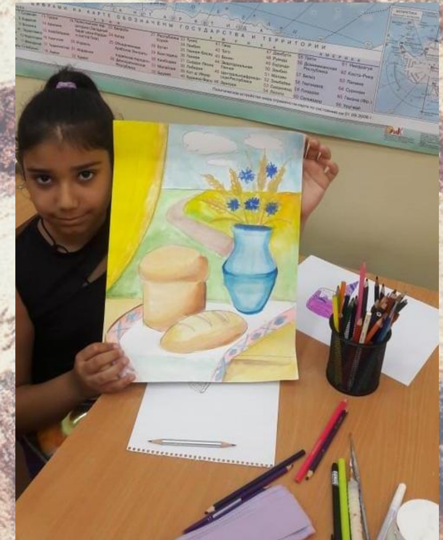
Гимназия №14 г.Ростова-на-Дону