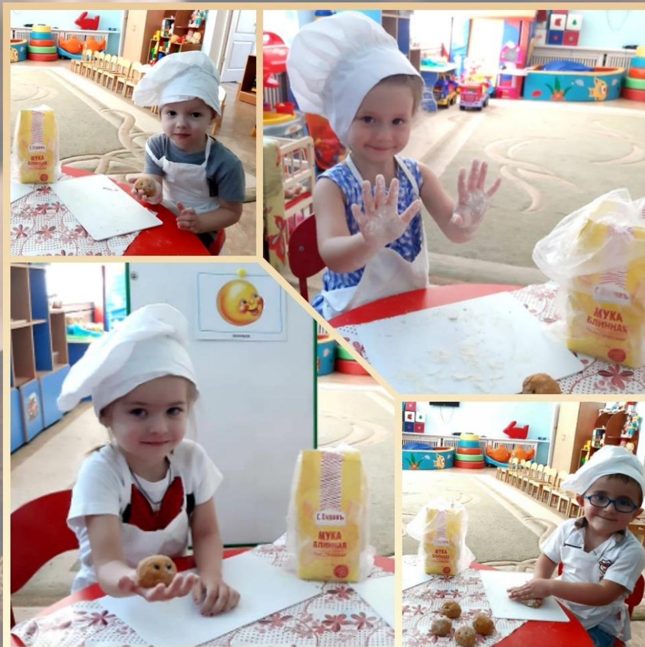
МБДОУ д/с №211 г. Ростов-на-Дону