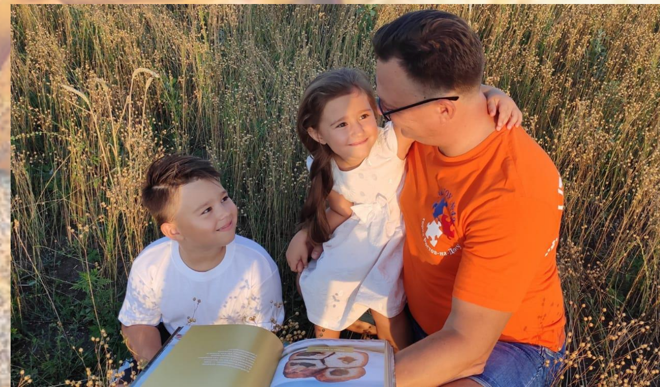
МАДОУ д/с №42