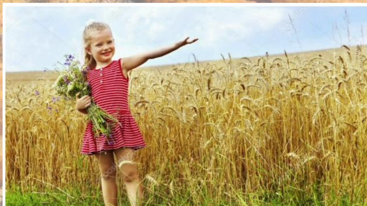
МБДОУ д/с №33 «Буратино» г. Новошахтинск