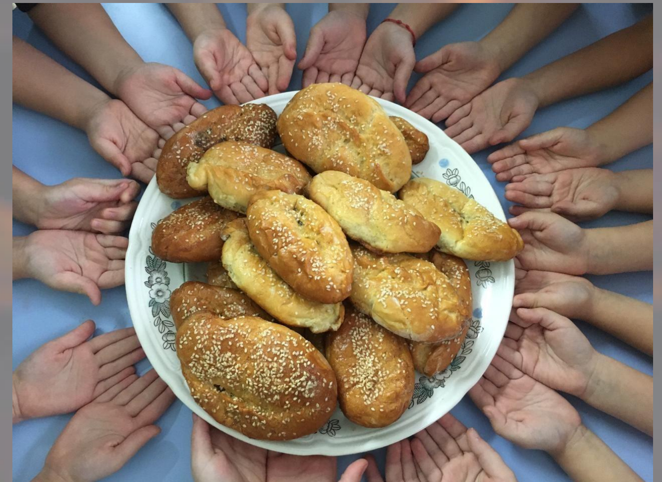
Детский сад г. Ростов-на-Дону