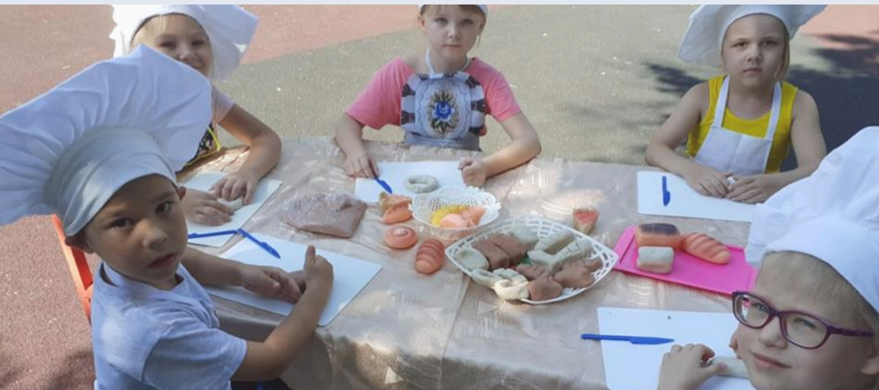
МАДОУ №304 г. Ростова-на-Дону