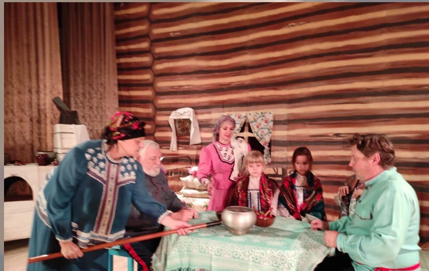
Театральная студия «Лицидеи» ГДК г. Красный Сулин