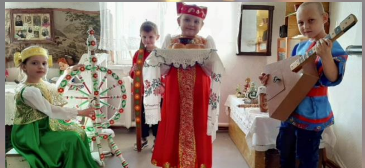
МБДОУ д/с №33 «Буратино» г. Новошахтинск