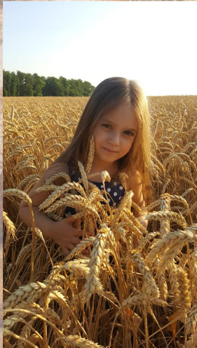
МАОУ «Школа 96 Эврика-развитие»