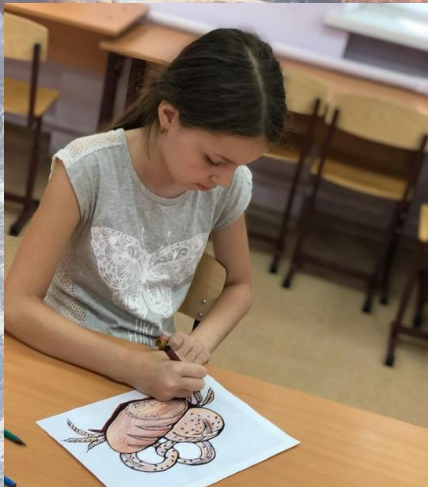
МБОУ СОШ №26 г.Ростова-на-Дону