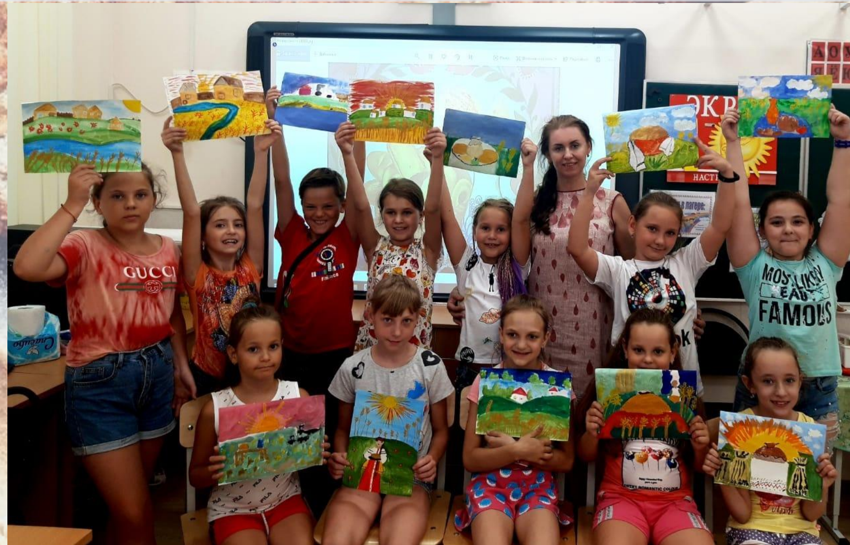
МБОУ СОШ №4 г. Донецк.