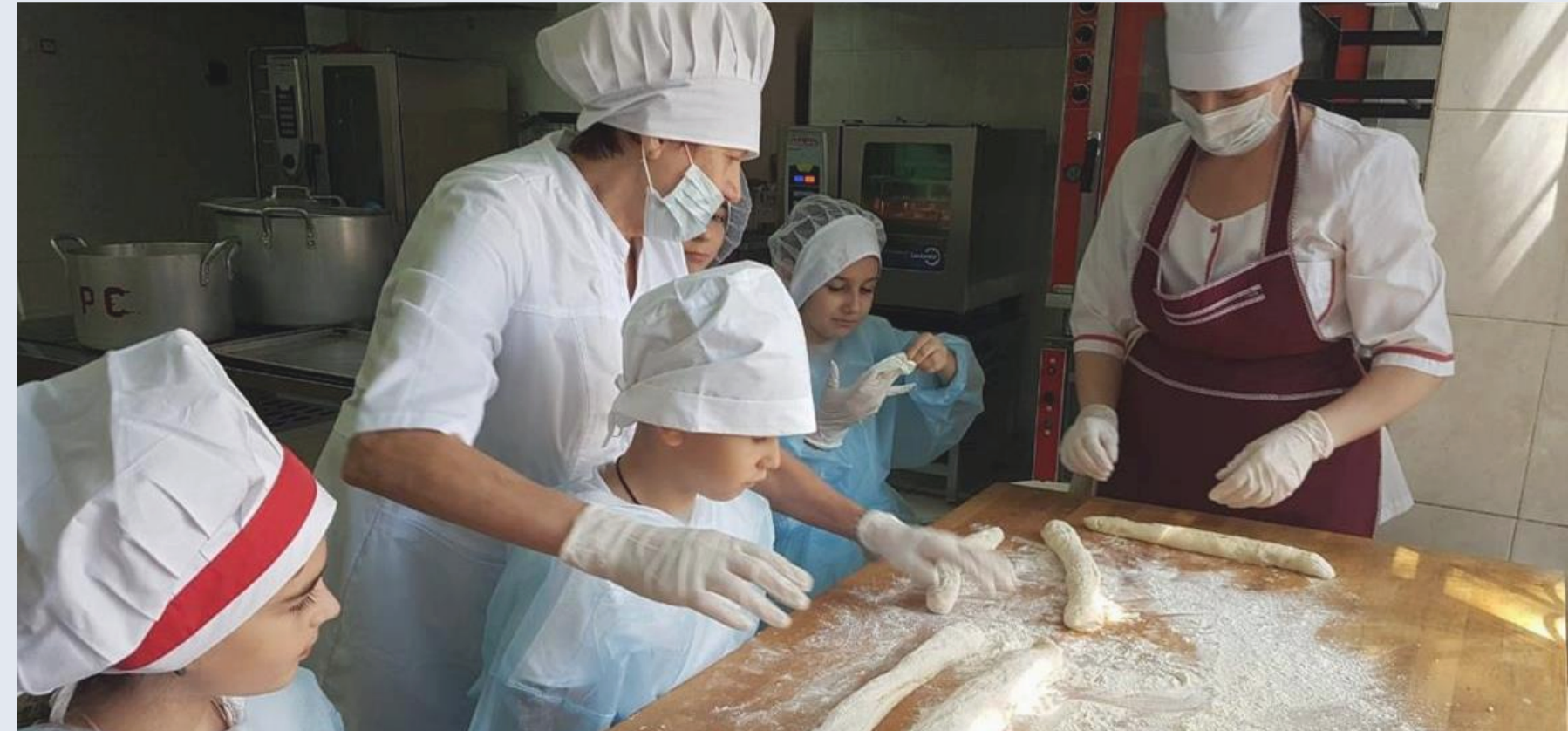
МБОУ «Школа№100» г. Ростова-на-Дону