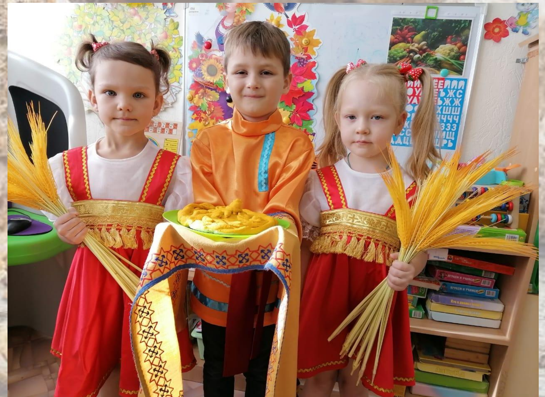
МБДОУ №291 г. Ростова-на-Дону