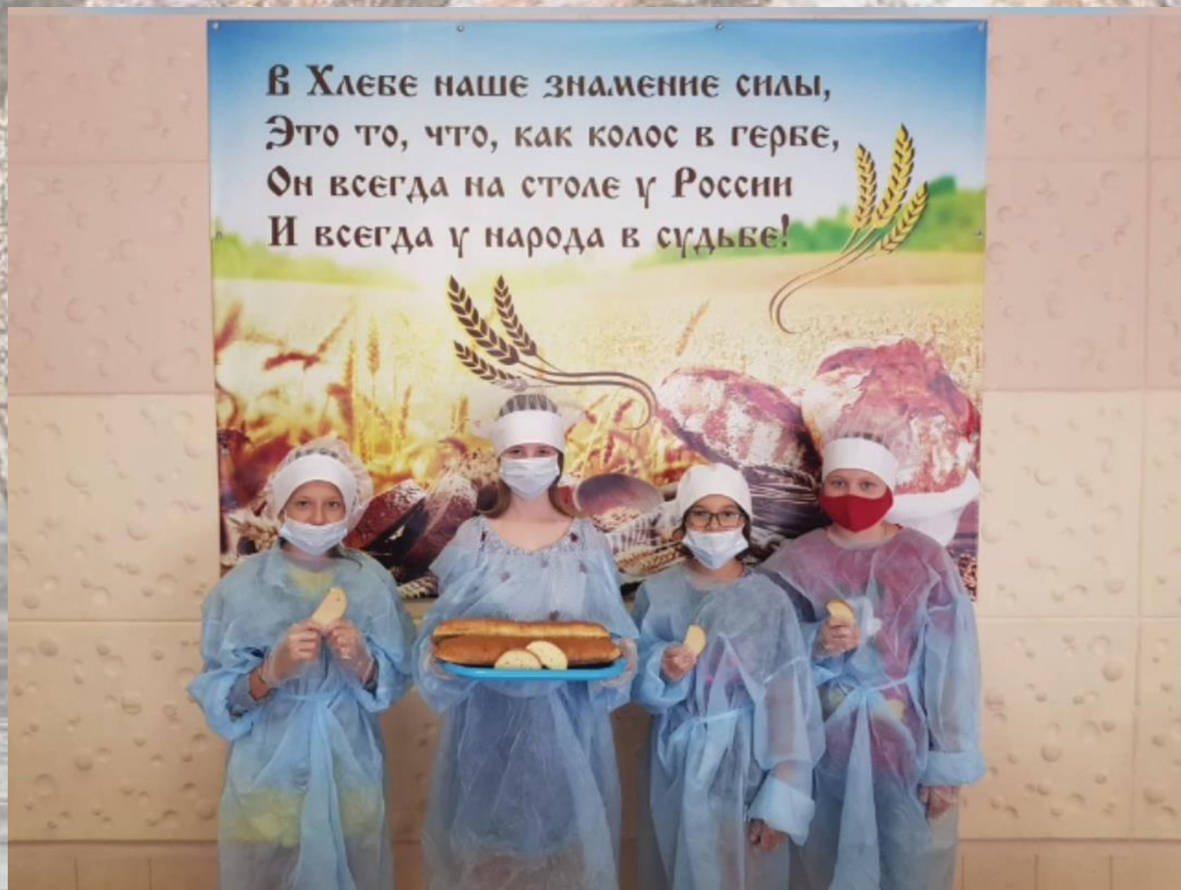
МБОУ школа 104 г. Ростова-на-Дону

КОМАНДОЙ ПРОЕКТА СОВМЕСТНО С ПАРТНЕРАМИ ПРОВЕДЕНЫ КОНКУРСЫ ДЕТСКОГО РИСУНКА, ПОСВЯЩЕННЫЕ ХЛЕБУ, ВЫСТАВКИ РАБОТ О ХЛЕБЕ, МАСТЕР-КЛАССЫ ПО ПРИГОТОВЛЕНИЮ ХЛЕБОБУЛОЧНЫХ ИЗДЕЛИЙ, СЕЛФИ, ЛЕКЦИИ, СЕМИНАРЫ, ТЕАТРАЛИЗОВАННЫЕ ПОСТАНОВКИ, КОНКУРСЫ, КРУГЛЫЕ СТОЛЫ, АКЦИИ, ЭКСКУРСИИ НА ПОЛЕ, В ПЕКАРНИ И НА ХЛЕБОЗАВОДЫ.