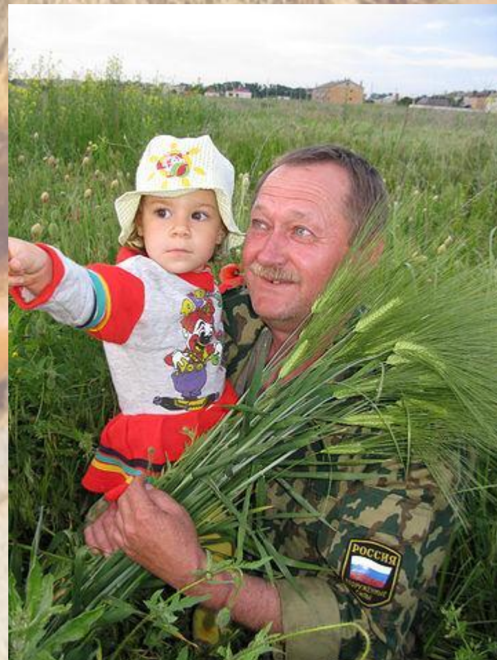
МАОУ «Школа 96 Эврика-развитие»