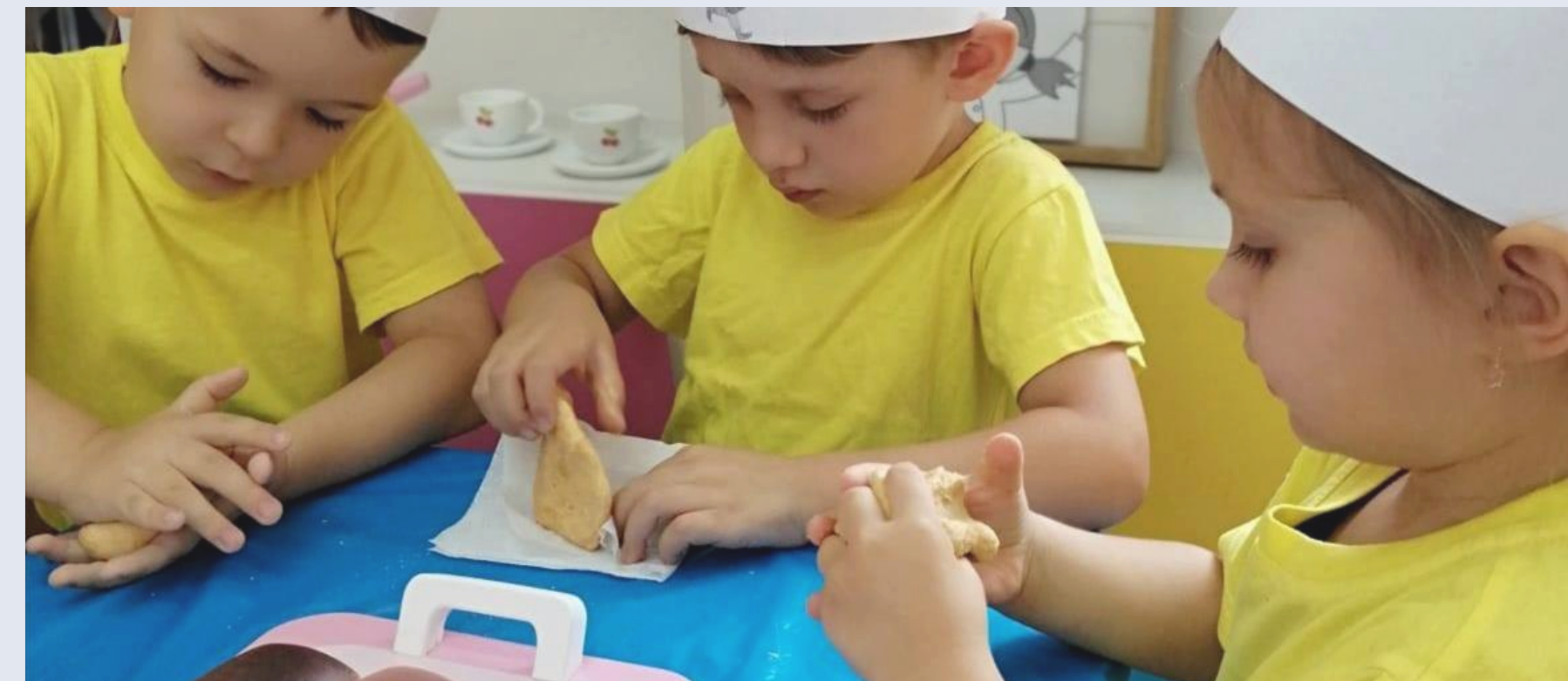
МАДОУ №42 г. Ростова-на-Дону